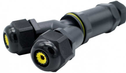
Tabela de Referências