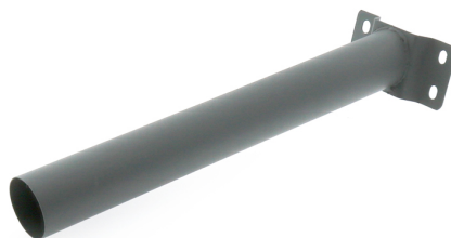
Tabela de Referências